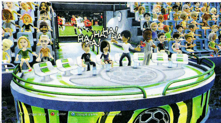
Sur le service Foot+, les avatars de la Xbox 360 peuvent réagir au match en direct.

Le jour où je l'ai emmenée sur le PlayStation Home, l'espace virtuel de la console Sony, pour lui présenter des amis, elle s'est rendue direct au centre commercial. Je lui dis : « Mais tu vas